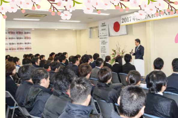
社長の歓迎の言葉から入社式は始まりました。

サンアイ自動車は今年も16名の新入社員を迎えました。一人一人が個性豊か、またサンアイに新しい風を吹かせてくれることでしょう。今後の彼らの活躍に期待大です。お客さま、お取引先企業さま、未熟な彼らですが少し温かい目で見守って頂きながら、これからもご指導ご鞭撻のほど何卒よろしくお願い致します!